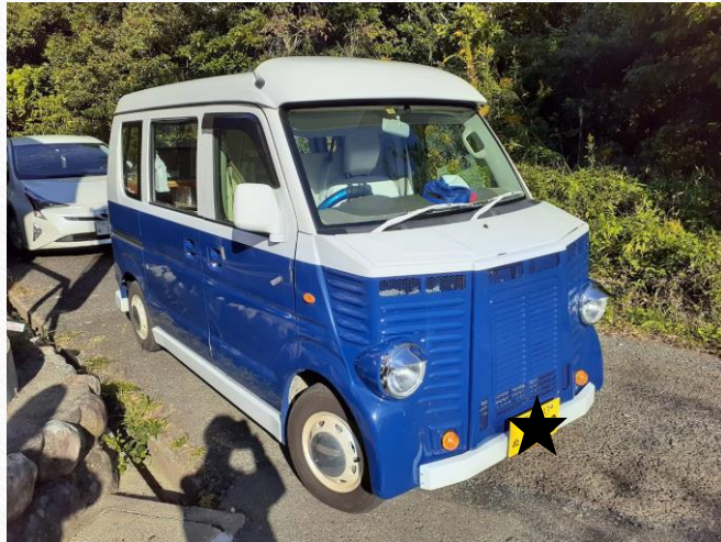
軽バンタイプ 230万円～