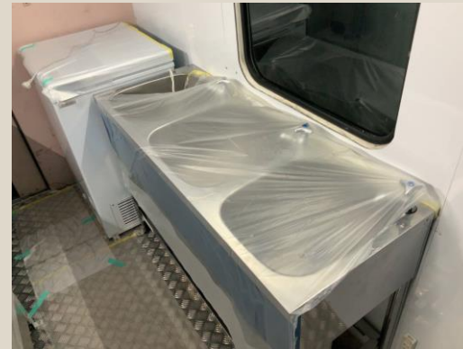
クイックデリバリータイプ