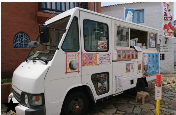
クイックデリバリータイプ 480万円～

軽バンタイプなら50万円～ 軽トラックなら100万円～ トラックタイプなら 250万円～