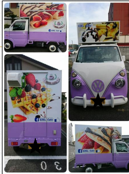
軽トラックタイプ 300万円～