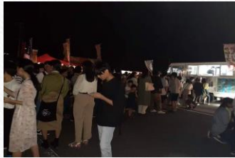
波切 わらじまつり