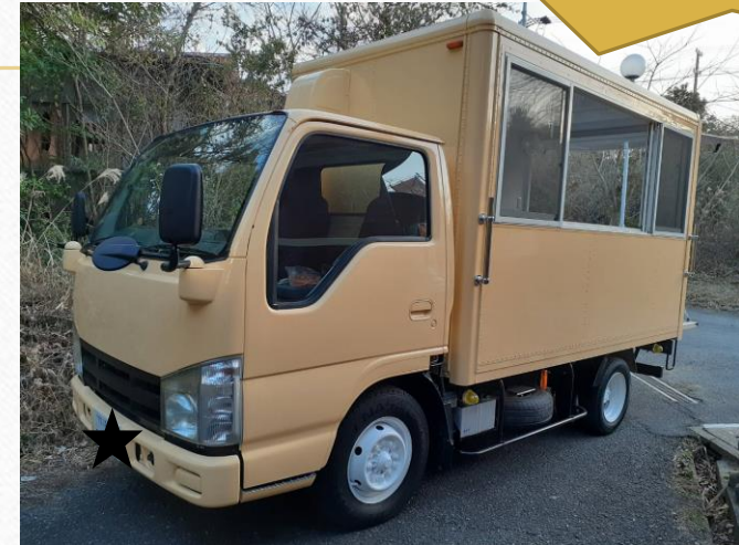
トラックタイプ (1.5トンor2トン) ※写真は1.5トンです 410万円～