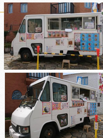
2トントラック ¥380万円～