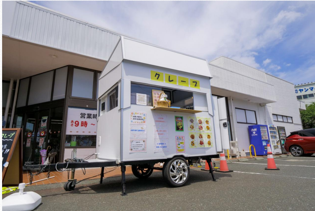
トレーラータイプ 380万円～